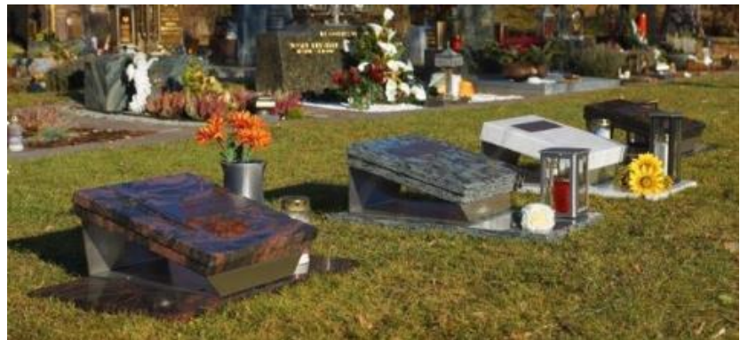
Möglichkeiten für die Gestaltung der Urnenerdgräber

Die Errichtung und Gestaltung, sowie die Kosten der Gräber trägt jeder Bürger. Als Richtlinie dient die überarbeitete Friedhofsordnung.