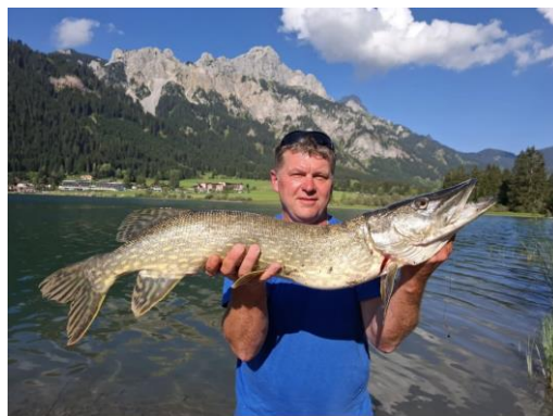
... und noch ein erfolgreicher Fang – diesmal ein Hecht mit 88 cm