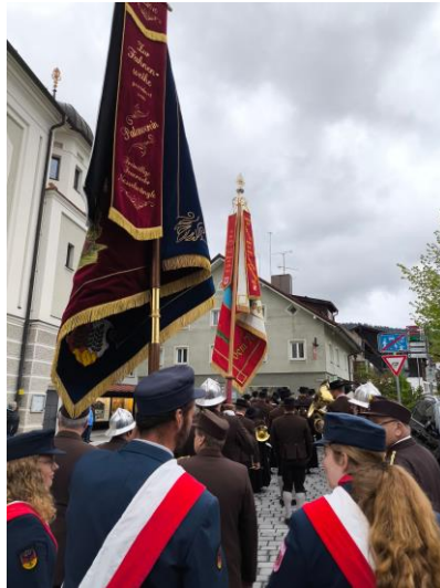
Besuch beim Floriani in Nesselwang