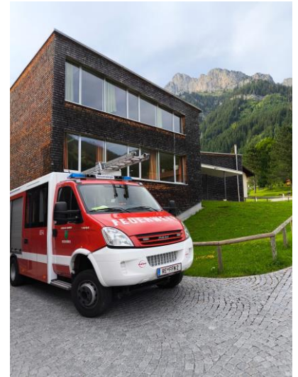
Einige Wespenester mussten heuer entfernt werden