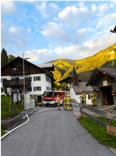
Eine der vielen Feuerwehrproben, diesmal in Rauth – Überprüfung der Löschleitung